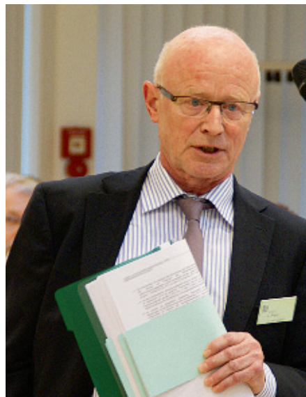
... als Diskutant in der VV