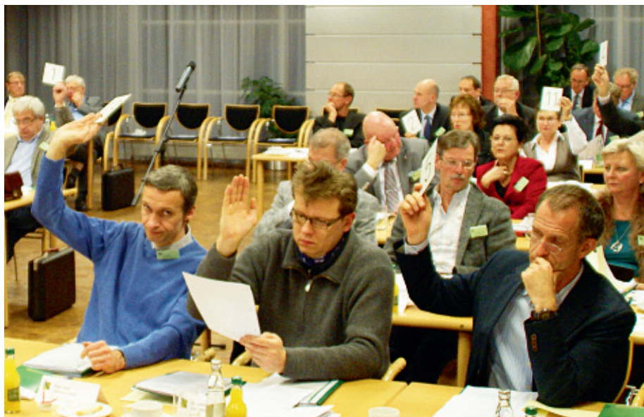
Abstimmungen und Diskussionen prägten die Beratung in Dresden.