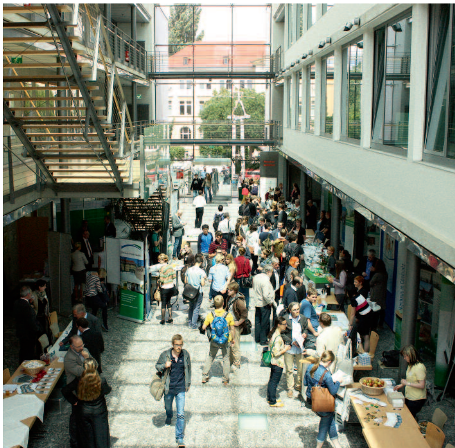
Andrang im Foyer des Medizinisch-Theoretischen Zentrums der TU Dresden

Weitere Informationen zur Förderung finden Sie unter www.kvsachsen.de → Aktuell → Förderung .