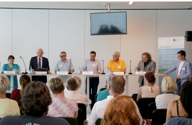
Diskussion über die vertragsärztliche Versorgung in Weißwasser im Traditionsraum der Lausitzer Füchse